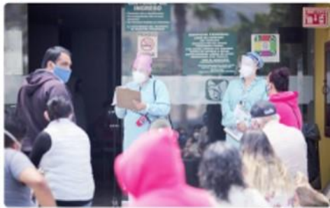
TIJUANA.- Debido a la alta movilidad se previó el fin de semana, la secretaria de Salud y la Coeprá realizaron verificaciones específicamente en bares y restaurantes.